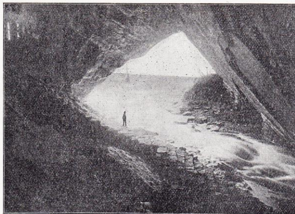
Grotte de Han. — Gouffre de Belvaux.

La transformation de l'éclairage électrique, réalisée récemment, est un vrai tour de force; d'une grande puissance, le nouvel éclairage permet d'admirer la grotte de Han sous des aspects inconnus